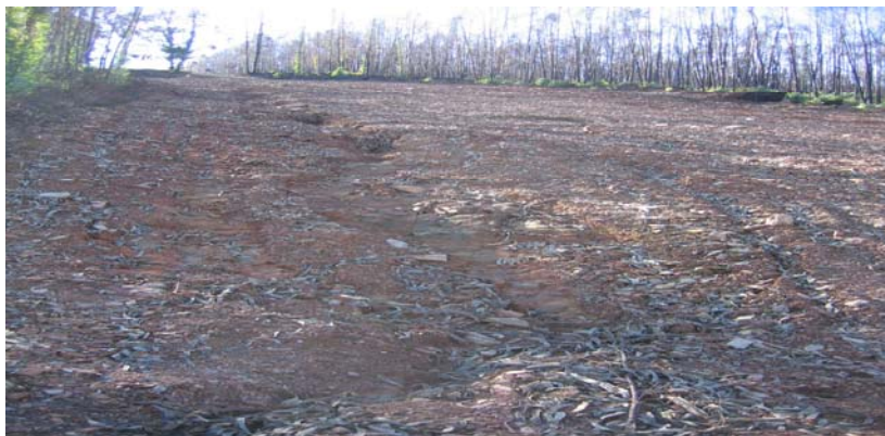
Foto 2 —Zona de corta- fuegos afectada aguas arriba del camino forestal. Sierra d'Ossa.