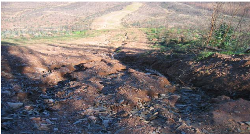
Foto 5 —Zona de corta-fuegos a bajo del camino forestal en Sierra d'Ossa.