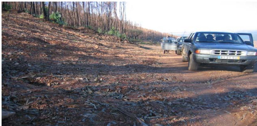
Foto 3 —Camino forestal afectado por acumulación de sedimentos y cárcavas.