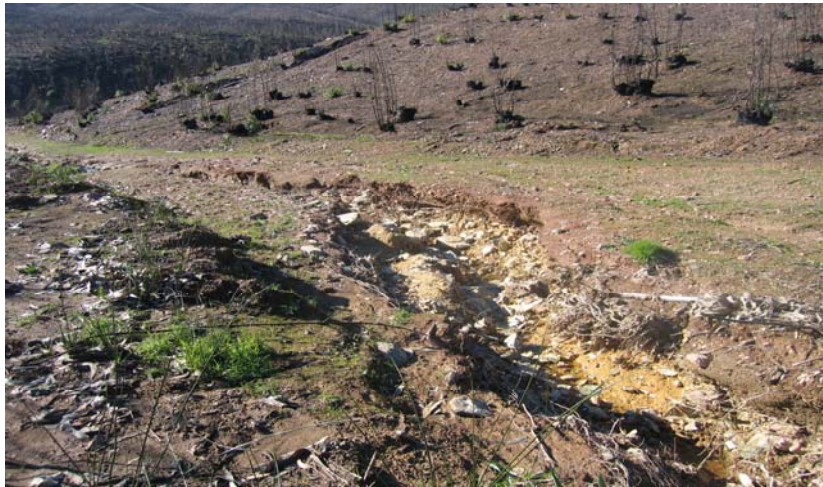
Foto 4 —Barranco formado en el transcurso de tres meses en Sierra d'Ossa.